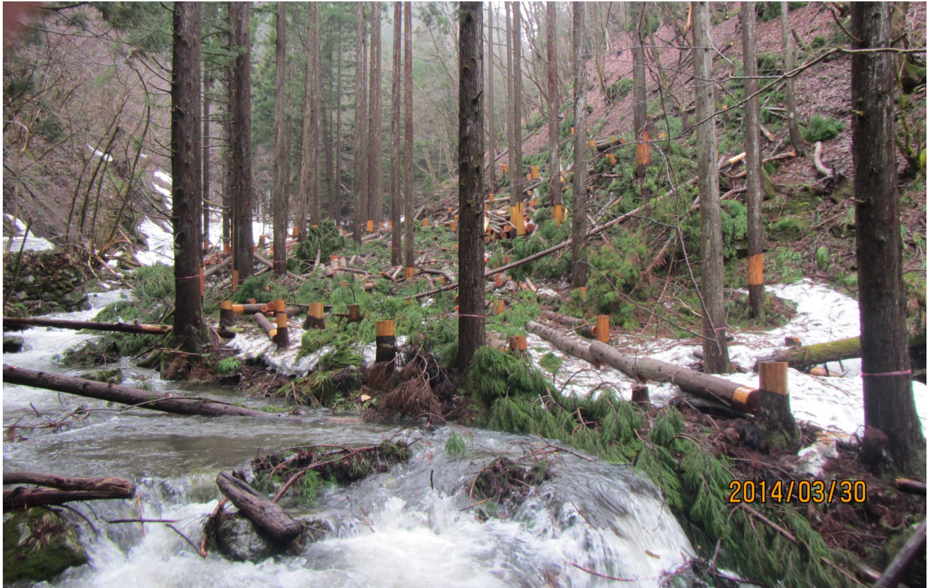
溪流魚の復活を願って、川岸のスギを除去し、花の咲く木に戻していく 2014. 3. 30 ↑ (花に来た虫が川に落ちて、溪流魚の餌となる。昔は30cmの魚が手づかみできたと集落のおばあさん)