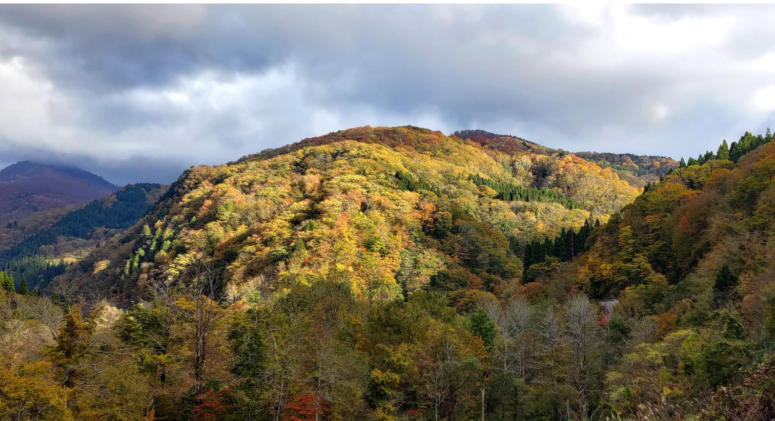
紅葉が見ごろを迎えた白山トラスト地周辺 (2022年10月28日 職員撮影)